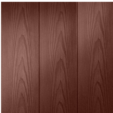
LIMBA PGT 43 Hnědá